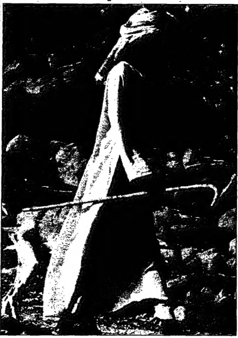
عرب سوداني من أعضاء حركة فتح يمدد سلعاً (ميناخ)

السودان الذي دعت المنظمة إلى وقف القتال بين الحكومة السودانية والمعارضين، وذلك من أجل توفير الغذاء للمدنيين في مناطق القتال. وتطالب المنظمة بوقف القتال بين الحكومة السودانية والمعارضين، وذلك من أجل توفير الغذاء للمدنيين في مناطق القتال. وتطالب المنظمة بوقف القتال بين الحكومة السودانية والمعارضين، وذلك من أجل توفير الغذاء للمدنيين في مناطق القتال. وتطالب المنظمة بوقف القتال بين الحكومة السودانية والمعارضين، وذلك من أجل توفير الغذاء للمدنيين في مناطق القتال. وتطالب المنظمة بوقف القتال بين الحكومة السودانية والمعارضين، وذلك من أجل توفير الغذاء للمدنيين في مناطق القتال. وتطالب المنظمة بوقف القتال بين الحكومة السودانية والمعارضين، وذلك من أجل توفير الغذاء للمدنيين في مناطق القتال.